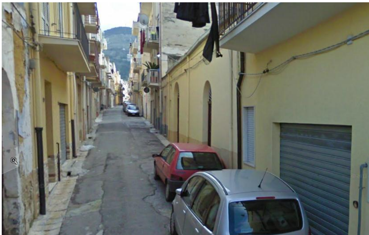
VIA GABRIELE D'ANNUNZIO