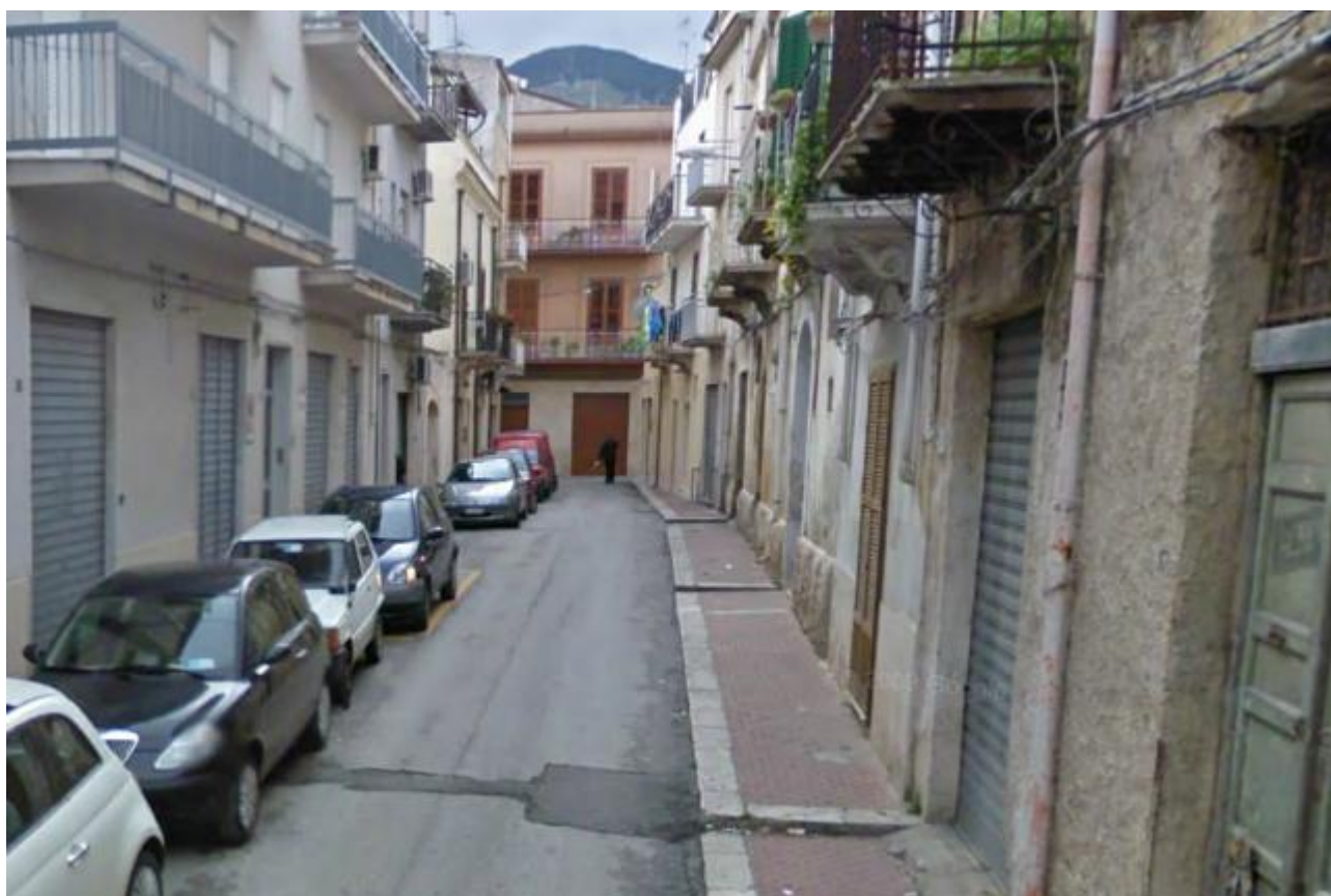
VIA GALILEO GALILEI