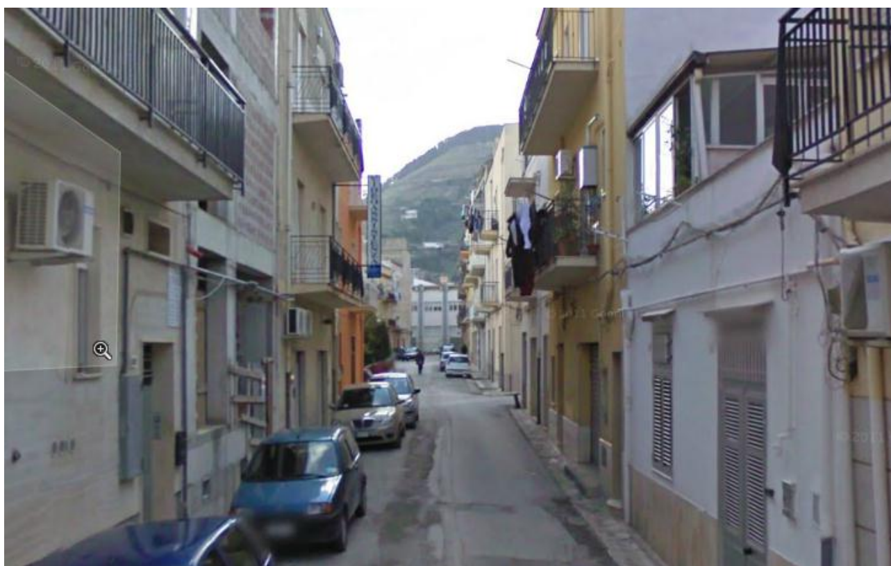
VIA MONTE GRAPPA