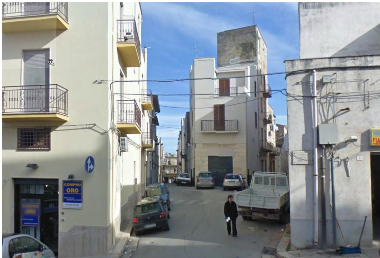
VIA MILITE IGNOTO