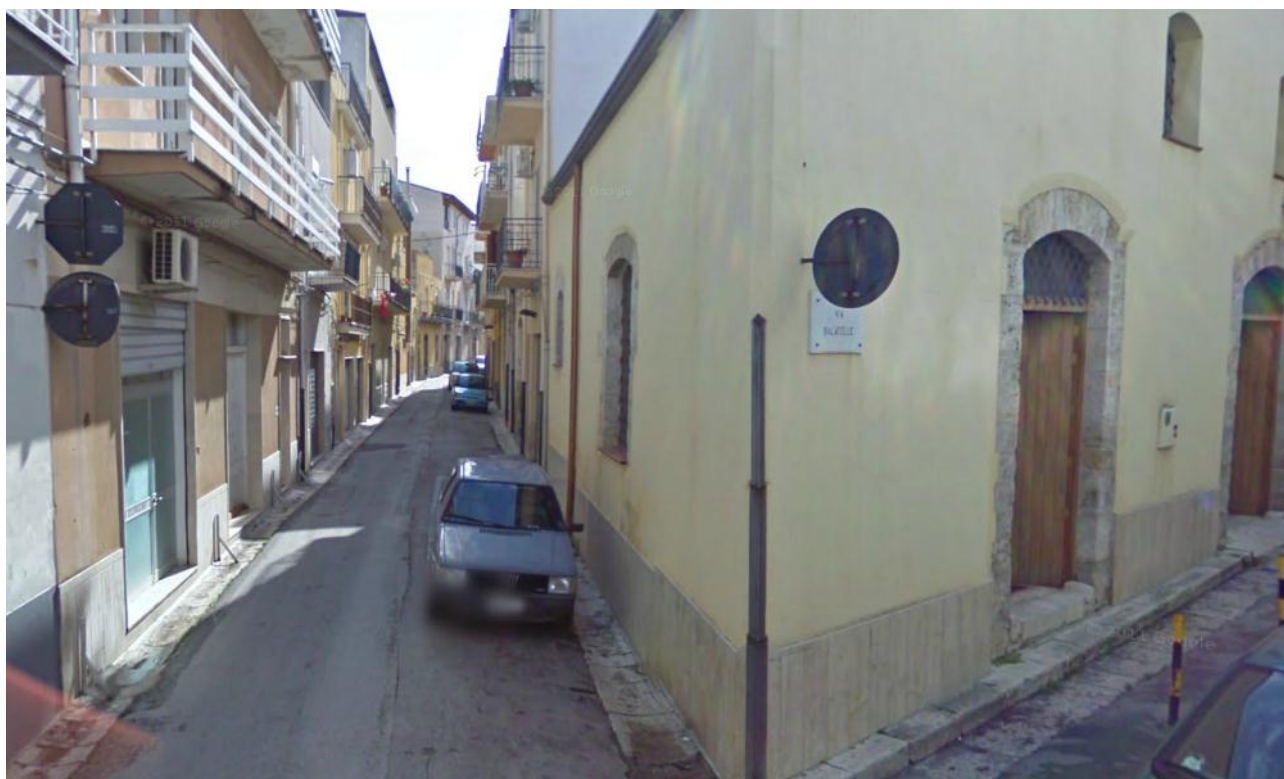
VIA SIMONE CORLEO