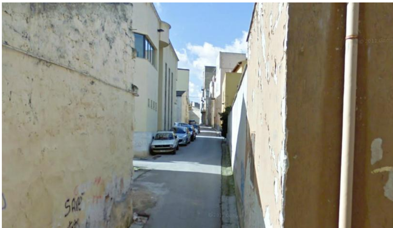
VIA SACERDOTE JEMMA